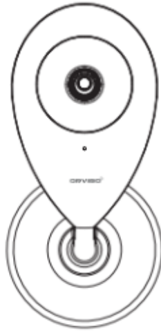
Cámara inteligente x1